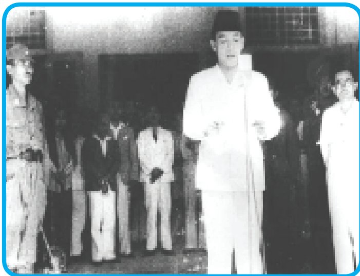
Gambar 3.4 Proklamasi Kemerdekaan tanggal 17 Agustus 1945 merupakan tanda berakhirnya hukum kolonial diganti dengan hukum nasional

Sebagai suatu negara yang merdeka, Negara Kesatuan Republik Indonesia mempunyai tata hukum sendiri. Tata hukum suatu negara mencerminkan kondisi objektif dari negara yang bersangkutan sehingga tata hukum suatu negara berbeda dengan negara lainnya. Tata hukum negara kita berbeda dengan tata hukum negara lainnya.