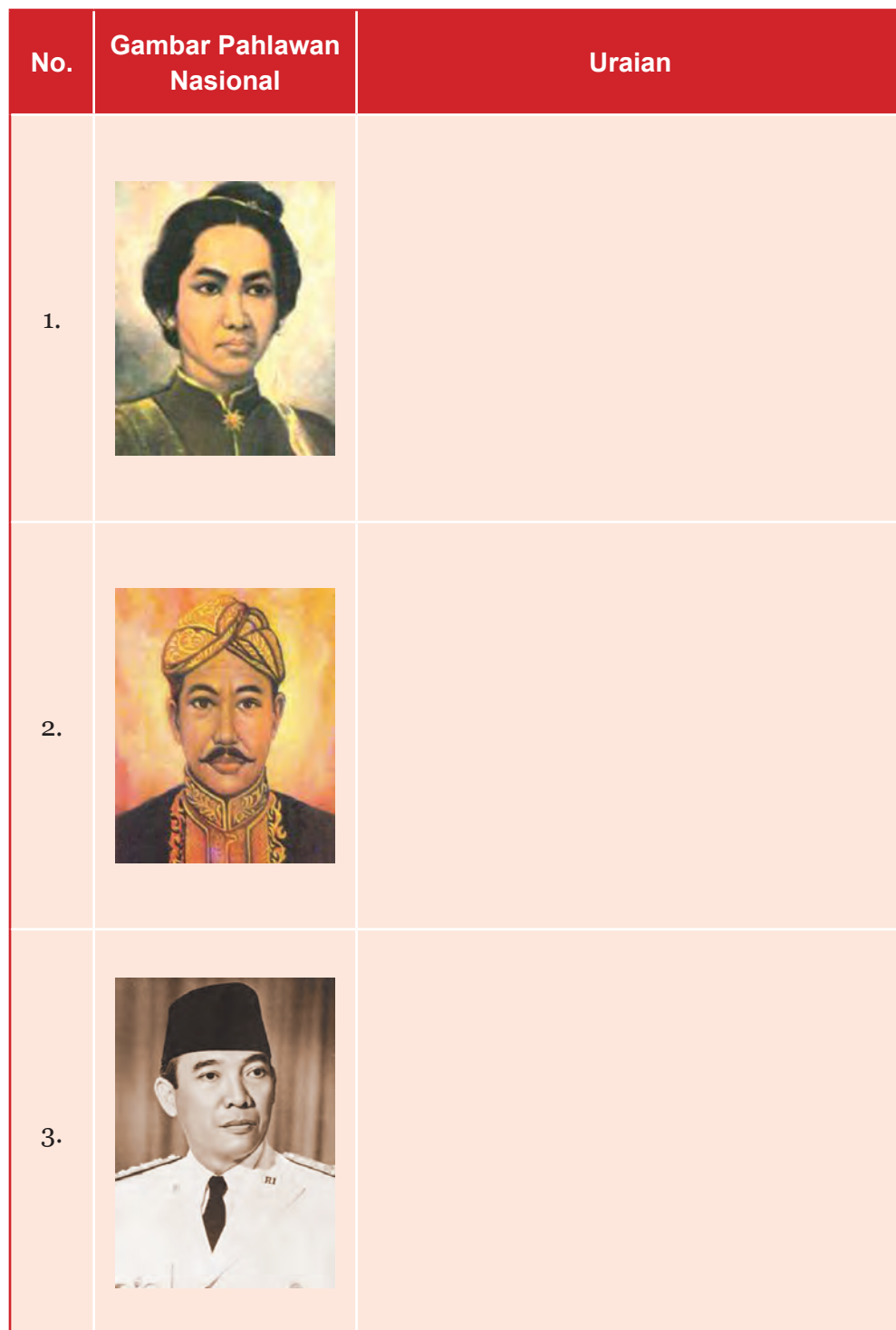
Tabel 6.3 Sekilas Pahlawan Nasional